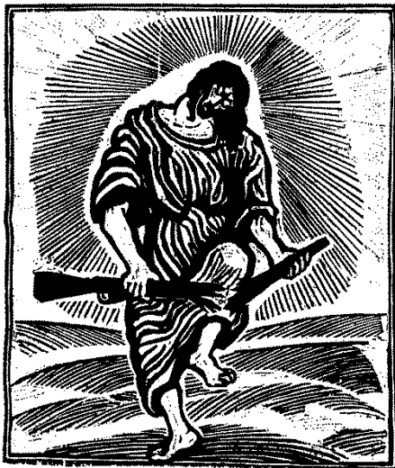
Otto Pankok, Christus zerbricht das Gewehr, Holzschnitt 1950

Streitkunst à la Gandhi und Jesus hat es in sich. „...die andere Wange hinhalten“ heißt nicht „ich bin ein Schwächling“, sondern „ich werde gewaltfrei offensiv“. Konflikte gehören zum Leben. Gütekraftiges, d.h. wohlwollendes und gerechtes